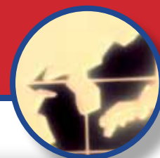
TABELLA 4D - SALDI COMMERCIALI DELL'UNIONE EUROPEA A 27 CON LA COREA DEL SUD SUDDIVISI PER PAESE (VALORI IN MILIONI DI EURO)