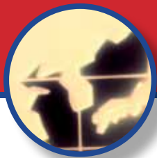
TABELLA 5A - INTERSCAMBIO COMMERCIALE (3) DELL'ITALIA CON LA COREA DEL SUD (VALORI IN MILIONI DI EURO)